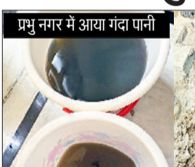
प्रभु नगर में आया गंदा पानी