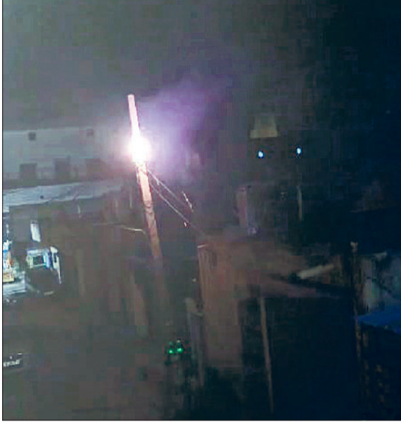
सोनीपत। विशाल नगर में एक खंबे से निकलती चिगारियां, विशाल नगर में गाड़ियों पर गिरी बिजली की तार।

रविवार को अधिकतम तापमान 33 डिग्री सेल्सियस रहा, जबकि शनिवार को यह 32 डिग्री था। हालांकि हवा में नमी और उमस के कारण तापमान का अहसास 45 डिग्री से कम नहीं था। दोपहर के समय सड़कें सूनी हो गईं, लोग घरों