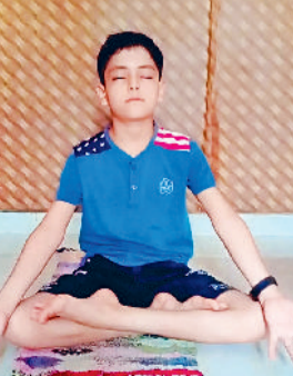
योग स्वस्थ जीवन जीने का एक प्राकृतिक मार्ग है। हमारे ऋषि-मुनि

शहीद दलबीर सिंह महाविद्यालय में रविवार को पूर्व छात्र मिलन समारोह का आयोजन किया गया। जिसमें महाविद्यालय एसोसिएशन के नए सदस्य तथा पुराने सदस्य व पदाधिकारी सदस्यों ने भाग लिया। इस वार्षिक मिलन समारोह में एसोसिएशन के सभी पदाधिकारियों ने नए सदस्यों का स्वागत किया तथा एक दूसरे का परिचय के साथ ही अपने अनुभव साझा किए। एसोसिएशन ने भविष्य में विभिन्न प्रकार के स्कूल कार्यक्रम तथा जरूरतमंद विद्यार्थियों की सहायता