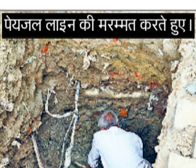
पेयजल लाइन की मरम्मत करते हुए।