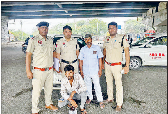
सोनीपत। अभियान के तहत राई पुलिस द्वारा गिरफ्तार किया गया अवैध हथियार रखने का आरोपी।

जिले में अपराधियों पर शिकंजा कसने के उद्देश्य से शुक्रवार रात 11 बजे से शनिवार तड़के 4 बजे तक सोनीपत पुलिस ने नाइट डोमिनेशन अभियान चलाया। इस दौरान 4317 वाहनों की गहन चेकिंग की गई, जिसमें 149 वाहनों के चालान किए गए और 23 को जब्त किया गया। अभियान में जिले की 90 प्रतिशत पुलिस फोर्स शामिल रही। नाकेबंदी के जरिए दोपहिया, चारपहिया व भारी वाहनों की चेकिंग की गई।