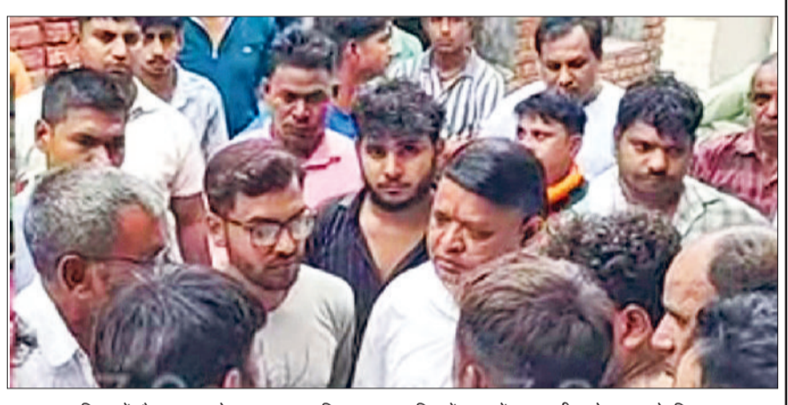
अस्पताल परिसर में मौजूद मृतक के स्वजन व नागरिक अस्पताल जिसमें स्वजनों द्वारा नसीब को उपचार के लिए लाया गया।

शहर के गौतम नगर में एक युवक की उसके पड़ोसी ने नुकीले हथियार (सुर) से हमला करके हत्या कर दी। वारदात को अंजाम मरा हुआ कुत्ता दफनाने को लेकर हुई कहासुनी को लेकर दिया गया। युवक को स्वजन नागरिक अस्पताल लेकर पहुंचे जहां उसे मृत घोषित कर दिया। मृतक चार बेटियों का पिता था। शहर थाना में मृतक के बड़े भाई की शिकायत पर केस दर्ज किया गया।