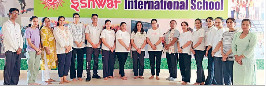
गोहाना। कार्यक्रम में प्रतिभागी शिक्षकगण।

मलिक का रहा। अध्यक्षता प्राचार्या योग विशेषज्ञ नरेश ने कहा कि संस्कृति का एक एक मजबूत स्तंभ है। योग हमारी प्राचीन संस्कृतिक